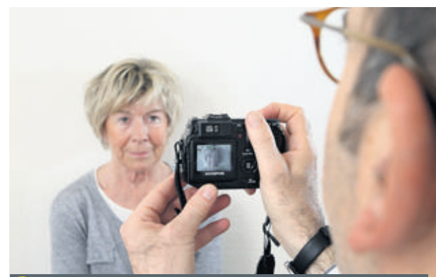
2 PHOTOS En prenant trois photos ordinaires, le nouveau programme permet de créer une image du patient en 3D.